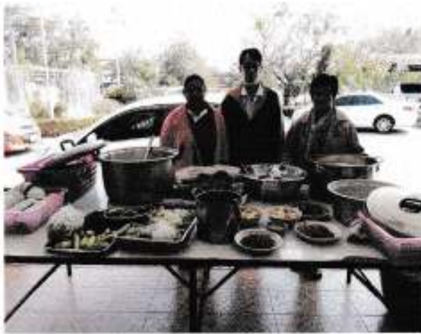
อาหารกลางวัน วันที่ 20 ธันวาคม 2560