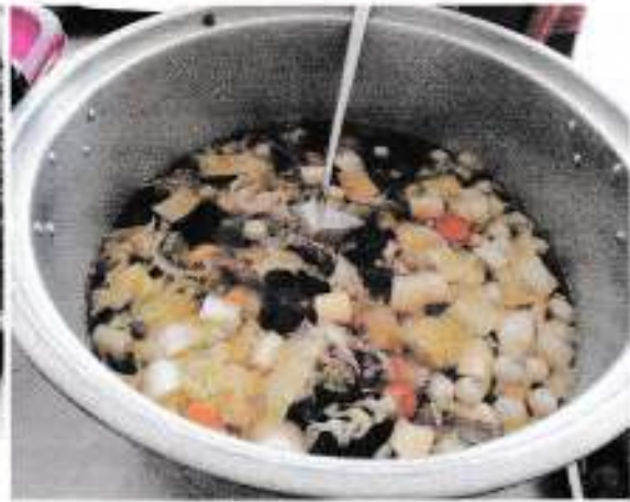
อาหารว่าง วันที่ 20 ธันวาคม 2560